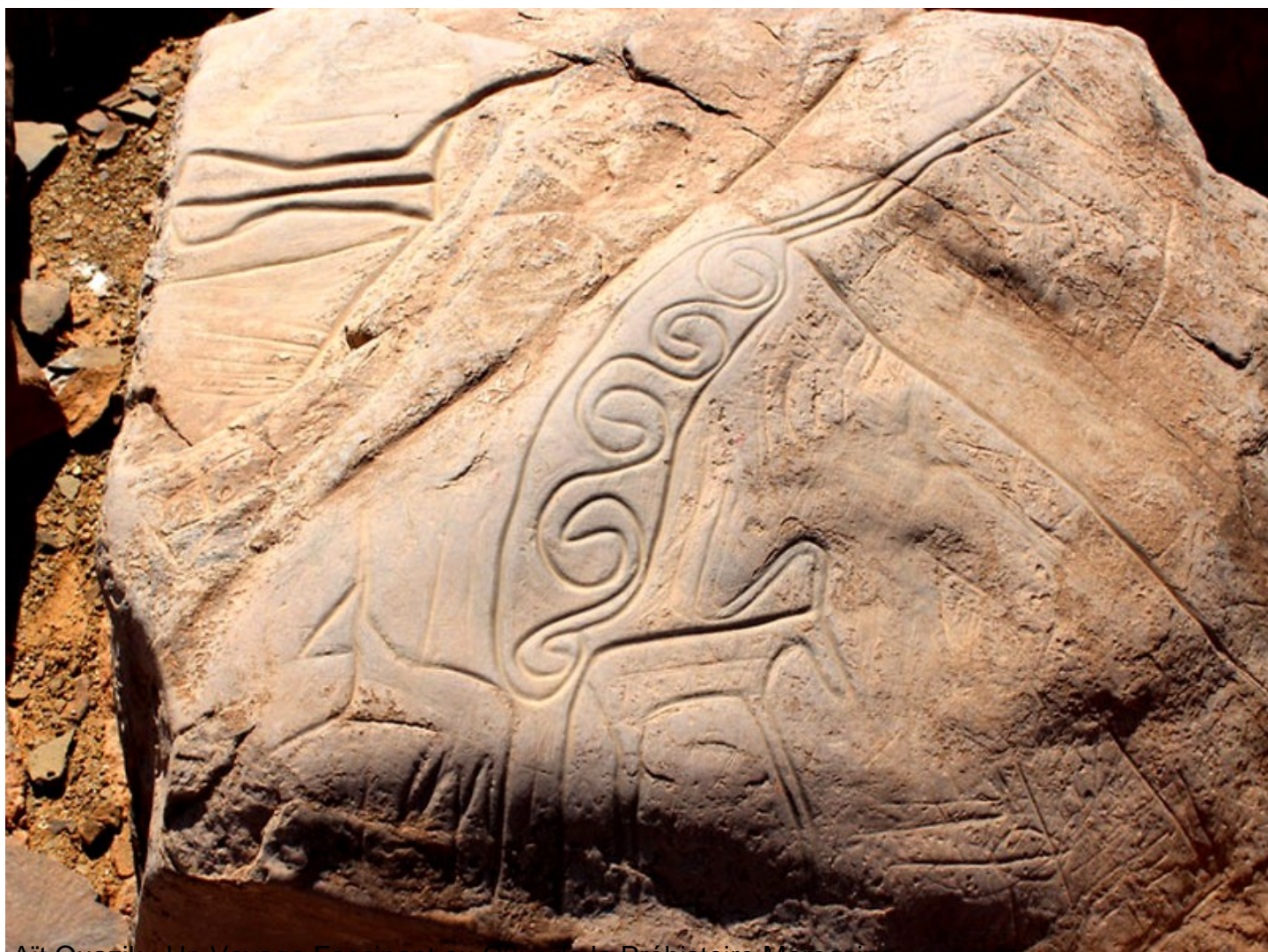
Aït Ouazik : Un Voyage Fascinant au Cœur de la Préhistoire Marocaine